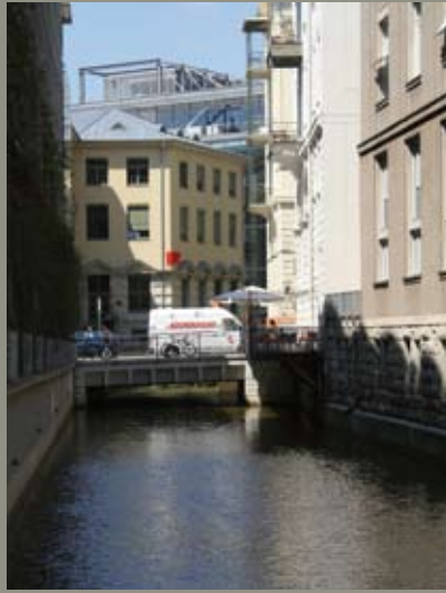
Impressionen aus Leipzig