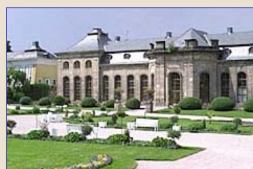
Gotha - Impressionen