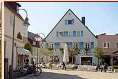
Crailsheim - Impressionen